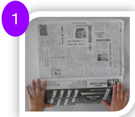
1 新聞の手前 4分の1に折る