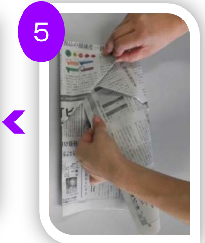
4で折った右の部分 を左に差し込む