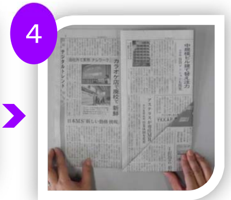
4 折返し、横3分の1の ところで、左右から折る