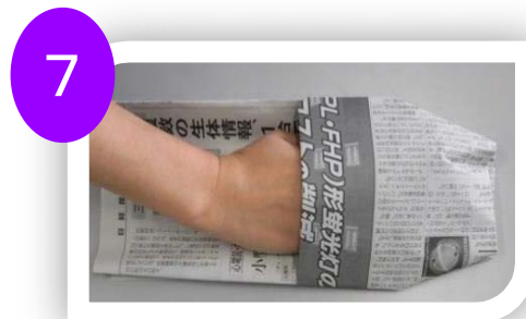
6を裏返して手がいる所に 足を入れスリッパとする。 (四角を小さく折り返すとよ りスリッパらしくなる。)